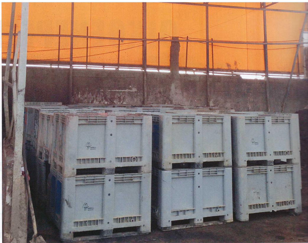
Η Re-Battery AE είναι το νέο Σύστημα Εναλλακτικής Διαχείρισης που αδειοδοτήθηκε από το ΥΠΕΚΑ στα τέλη του 2011. Στους 20 μήνες λειτουργίας της παρουσιάζει αξιοθαύμαστη εξέλιξη. (φωτό από τις εγκαταστάσεις «Ι. Χούμας Α.Ε.Β.Ε.»).